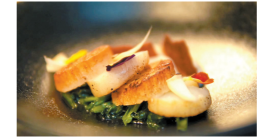
西餐菜式加入了新创意

这一点和他做菜的理念不同。他认为，西餐大师们喜欢“就地取材”，这一点和广州人“不时不食”的观点是一致的。他想印证自己的想法，孩提的梦想瞬间浮现。于是，他辞去工作，寻找能够实现自己想法的机会。