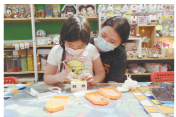
伍女士与女儿享受手工制作的亲子时间

“在这个空间里，我能找回自己想要的生活。”一年前，郭晓莹辞去会计师的工作，与身为服装设计师的姐姐一道创立手作工作室。从小对手工制作有浓厚兴趣的郭晓莹认为自己对手作有独特天赋，对比按部就班的会计工作，郭晓莹更喜欢手工制作带来的愉悦感：“我曾经经历过都市人的职场压力，现在做着自己喜欢的手活，放下一切纷扰杂事，将注意力专注于指尖之间，十分减压。看到自己动手制作的成品，更有着满满的成就感。”