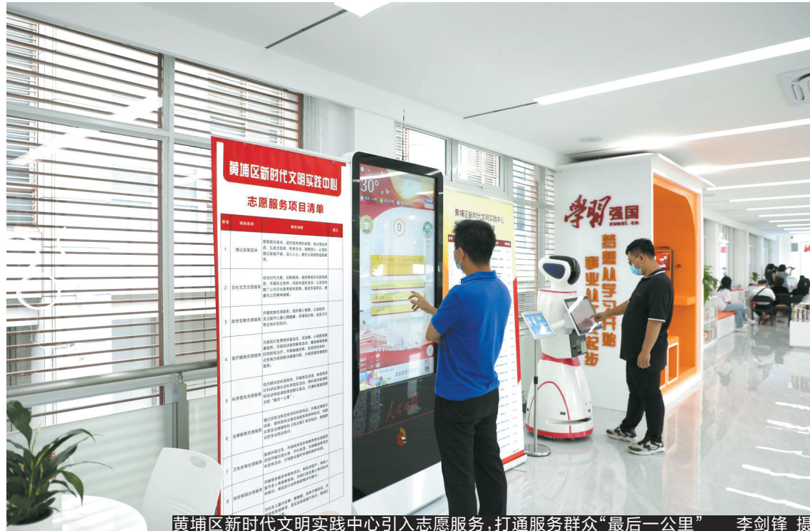
黄埔区新时代文明实践中心引入志愿服务,打通服务群众“最后一公里”

在广州市海珠区阅江路碧道,人们用手机扫码就能听到红色历史文化故事,通过“5G+VR”的形式,就能“体验”红色革命故事场景。据了解,海珠区聚焦“五新”文明实践特色阵地(五