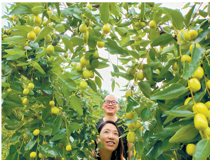
喜看脆枣丰收

五年的苦心开发，我带领村民已种植果树1000亩，其中枣子700亩、猕猴桃200亩、贵妃橙和帝王柑100亩，将昔日的荒山荒田变成名副其实的花果山。当初秋时节，我见到漫山遍野的枣儿由青转红，在摇曳的枣树上，享受着阳光雨露，醉人的甜蜜清