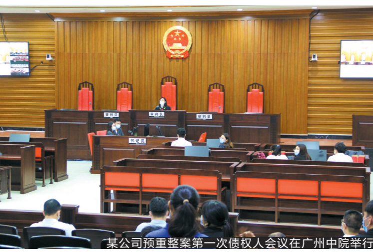
某公司预重整案第一次债权人会议在广州中院举行

1. 坚持市场化原则“办理破产”,加强破产前调解,灵活运用破产和解规则。消除破产“污名化”的不良影响,明确破产程序路径,引导困境中小微企业及时通过破产程序实现再生和有序退出。加强立审执破程序衔接,对于债务人、债权人提出的破产申请及时依法审查,应收尽收。积极开展中小微企业破产前调解,鼓励债权人与债务人通过协商方式化解债务风险,避免对持续经营能力和发展前景的中小微企业破产清算。在破产程序中引导债权人、出资人等利害关系人运用债务减免、延期支付、代为清偿、提供担保等多种方式达成和解,尽可能保住市场主体,保住就业。