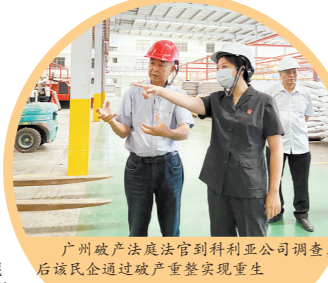
广州破产法庭法官到科利亚公司调查,后该民企通过破产重整实现重生

广州破产法庭自2019年12月揭牌成立以来,先后制定快速审理、破产重整、财产处置等十余项审判业务文件,为破产审判提质增效提供有力支撑;联合相关职能部门制定6项文件,建立了高效的常态化破产工作协作机制。截至目前,广州破产法庭适用简易程序审结破产案件911件。破产前调解案件共420件,破产和解案件共23件。所审理的破产清算案件共清理债务947.24亿元。盘活中心城区不动产291.37万平方米,11家中小