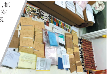
▲广州破获“2·28”特大虚开骗税专案

截至今年6月底,广东公安机关共侦破骗取留抵退税案件15起,打掉犯罪团伙16个,抓获犯罪嫌疑人105人,涉案价税合计约37.4亿元,涉及留抵退税款2566.5万元;配合税务部门查处骗取留抵退税违法案件70余起,成功阻断骗取留抵退税款1.4亿元,有力遏制了广东省骗取留抵退税犯罪上升势头。