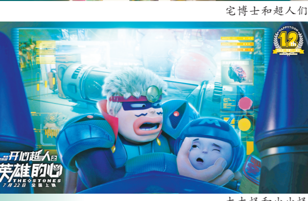
宅博士和超人 大大怪和小小怪