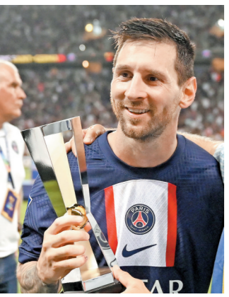
梅西手捧法超杯

法国超级杯昨天在以色列特拉维夫上演，法甲冠军巴黎圣日耳曼以4比0轻取法国杯冠军南特。梅西不仅获得职业生涯第41个冠军头衔，还被评为了最佳球员。如果再获得两项冠军，梅西就将追平前巴塞罗那队友阿尔维斯(43冠)并列足坛历史最高。