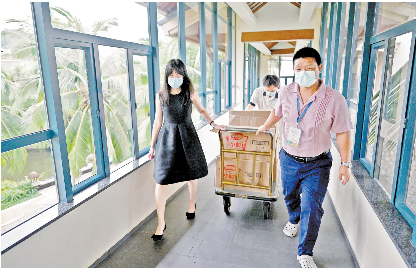
8月8日，三亚亚龙湾一家酒店的工作人员将生活物资送往客房