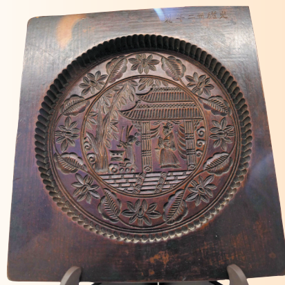
有着上百年历史的“月宫玉兔捣药板式月饼模”