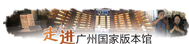
走进广州国家版本馆

中秋佳节将至，广州国家版本馆以近现代月饼包装和月饼模具为载体，上新了一场别开生面的“团圆——广式月饼文化专题版本展”。展览分为“源起 中秋礼俗”“广式自成一派”“感恩 礼以食成”“国潮 文化自信”“同根 团圆味道”“问天 人月团圆”六个部分，通过广式月饼物件版本的发展变迁，材质造型、工艺特色和文化传承，让观众品读不同年代与地区的中秋佳节习俗，体会小小月饼背后蕴含的浓浓家国情怀。