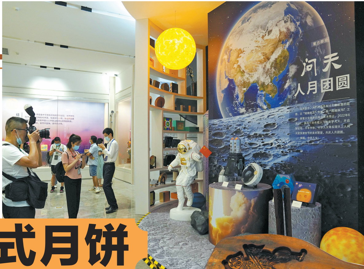
展览第六部分‘问天人月团圆’

中秋佳节将至，广州国家版本馆以近现代月饼包装和月饼模具为载体，上新了一场别开生面的“团圆——广式月饼文化专题版本展”。展览分为“源起 中秋礼俗”“广式自成一派”“感恩 礼以食成”“国潮 文化自信”“同根 团圆味道”“问天 人月团圆”六个部分，通过广式月饼物件版本的发展变迁，材质造型、工艺特色和文化传承，让观众品读不同年代与地区的中秋佳节习俗，体会小小月饼背后蕴含的浓浓家国情怀。