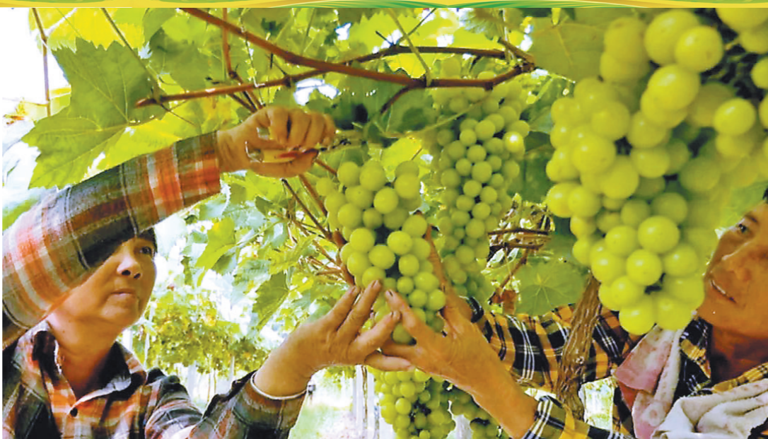
村民采摘成熟的葡萄,准备打包发售

为把产业发展好,达到产业良性发展、驱动发展的目的,大布镇率先在乳源成立首家镇级乡村振兴平台企业,改变传统小作坊生产加工的方式;筹集近500万元资金,建设大布镇“峡谷山宝”乡村振兴先行示范带——垌头村腐竹厂房建设项目;还与高校合作,研发笋干、番薯干即食化生产线项目。