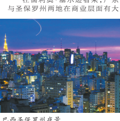
巴西圣保罗州夜景

2007年，广东省和圣保罗州缔结为友好省州关系。广东省和圣保罗州都在各自国内的经济中占据重要地位，双方紧密合作必将进一步推动两地的经贸交往。 圣保罗州国际关系厅厅长儒利奥·塞尔逊日前在接受羊城晚报记者独家专访时称：“广东和圣保罗都为巴西提供了经济动力，圣保罗州的GDP在巴西国内的占比同样很大。自然而然，中国和巴西有大量的交往需要经过广东和圣保罗。” 在儒利奥·塞尔逊看来，广东省与圣保罗州两地在商业层面有大量