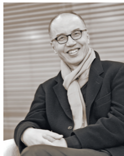
著名作曲家陈其钢