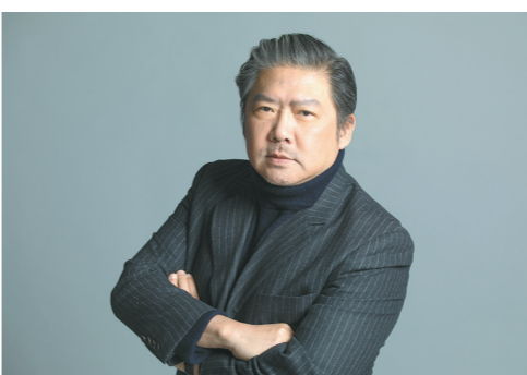
广州交响乐团音乐总监余隆

作品中,挑选出了12部最具代表性作品的世界首演或最佳实况录音,集结出版一套《交响·中国——庆祝广州交响乐团成立65周年原创委约作品集萃》,近日就将在线上线下同步发行。“委约创作”一般指委约方委托心仪的以及认为是合适创作某题材(或体裁)的作曲家,在约定的时间内创作出约定题材及形式的作品。业内公认,如果一个乐团委约作品的数量多、演出频繁、传播广泛,继而得到国内外业界和听众的接受和喜爱,便可反映出乐团的艺术初心、社会责任以及品牌积淀等硬实力。陈肇告诉羊城晚报记者,广交一直在探索用交响乐讲述中国故事、传递广东声音,特别是在委约创作方面更是不遗余力,十数年如一。这张“交响·中国”专辑,就是一幅汇聚中外当代作曲家的群像图,从中可见余隆和广交过去20年来选题视野的广泛,可见其委约视角与时代脉动的精准应和。