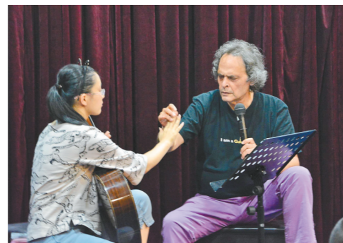
2015年在长沙与古典吉他演奏家罗兰·迪恩斯交流