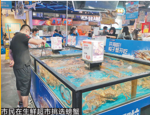
市民在生鲜超市挑选螃蟹