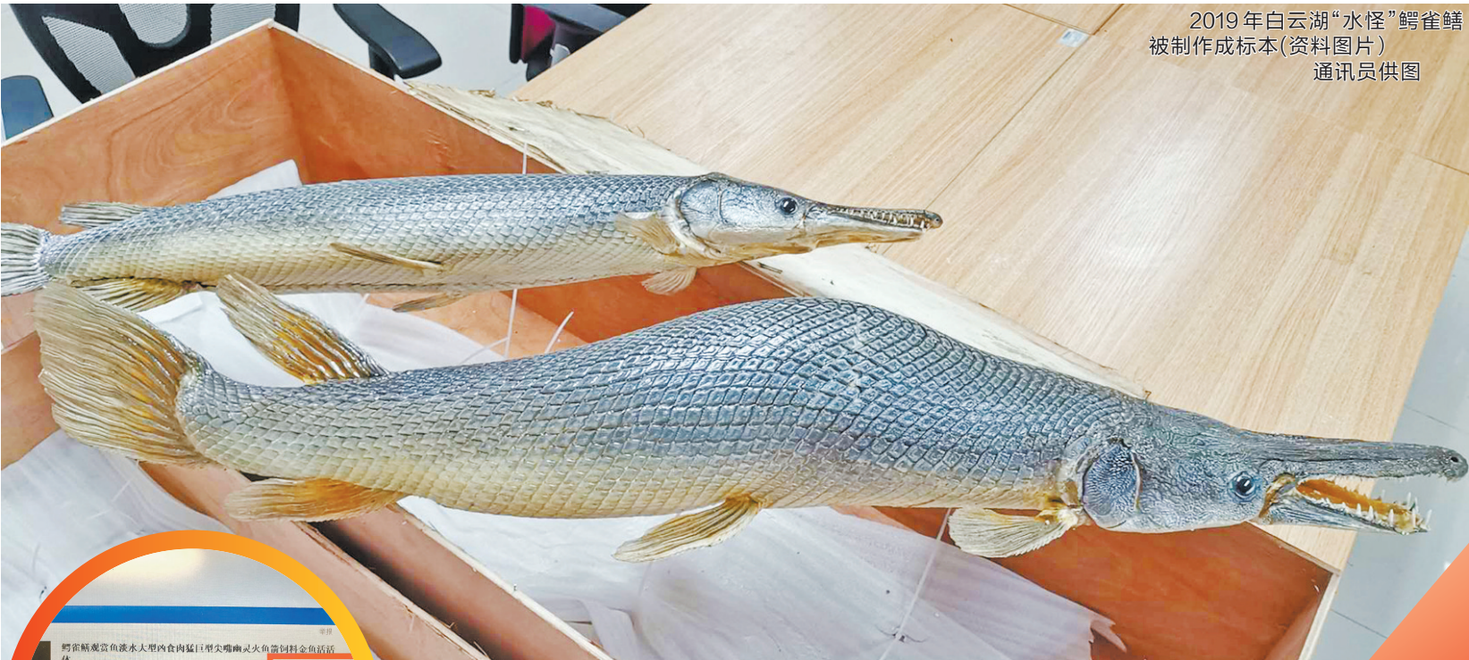
2019年白云湖“水怪”鳄鱼鳢被制作成标本(资料图片) 通讯员供图