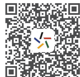
广东体彩网点征召平台