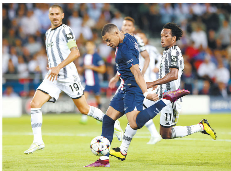
姆巴佩(前)梅开二度

姆巴佩错失得分良机之后，大巴黎很快就丢球了。第53分钟，帕雷德斯开出短角球，斯科蒂奇左路传中，替补出场的麦肯尼高高跃起头球攻门，为尤文扳回一分。唐纳鲁马出击到一半停住了，造成了大巴黎的失球。斯科蒂奇是上赛季欧冠最佳球员和助攻王，在代表尤文的欧