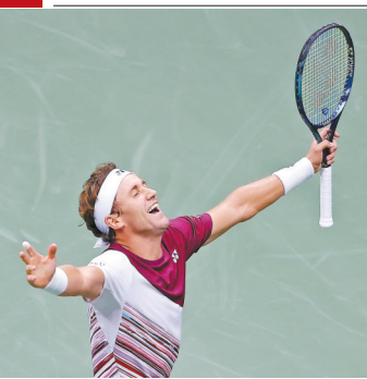
挪威名将鲁德