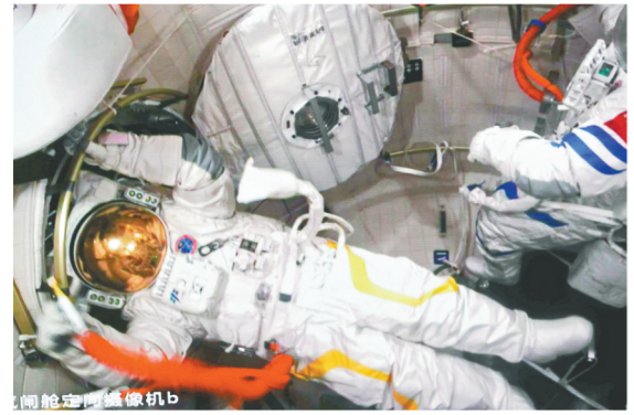
航天员蔡旭哲结束出舱任务返回舱内实验舱的画面