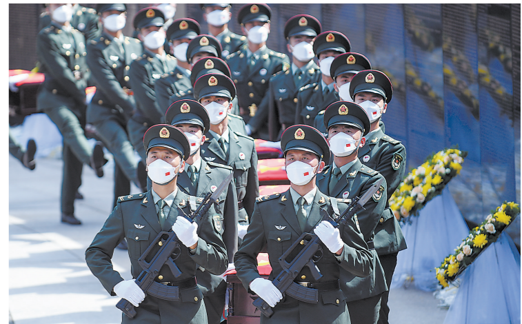
9月17日，礼兵护送志愿军烈士遗骸棺椁进入沈阳抗美援朝烈士陵园安葬地宫