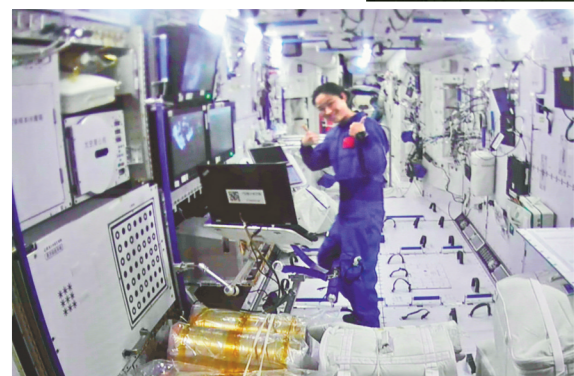
航天员刘洋为圆满完成出舱任务的航天员陈冬、蔡旭哲点赞的画面