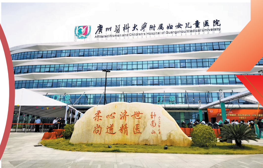
广州医科大学附属第三医院黄埔院区正式投入运营

据介绍,黄埔新院区与荔湾老院区在学科建设、人才培养、资源配置等方面实行一体化、同质化管理,专家团队将在两个院区出诊,让患者在不同的院区享受同一质量、同一水平的诊疗服务,切实为解决广州东部妇女儿童就医问题服务。