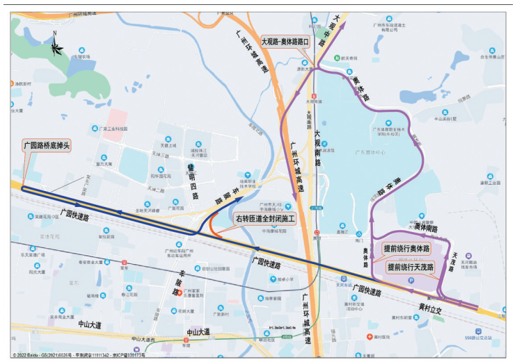
广园快速路车陂路交叉口东往北匝道全封闭施工绕行路线

施工期间,请过往车辆留意现场指引,听从现场交通疏导人员的指挥,合理选择绕行路线。