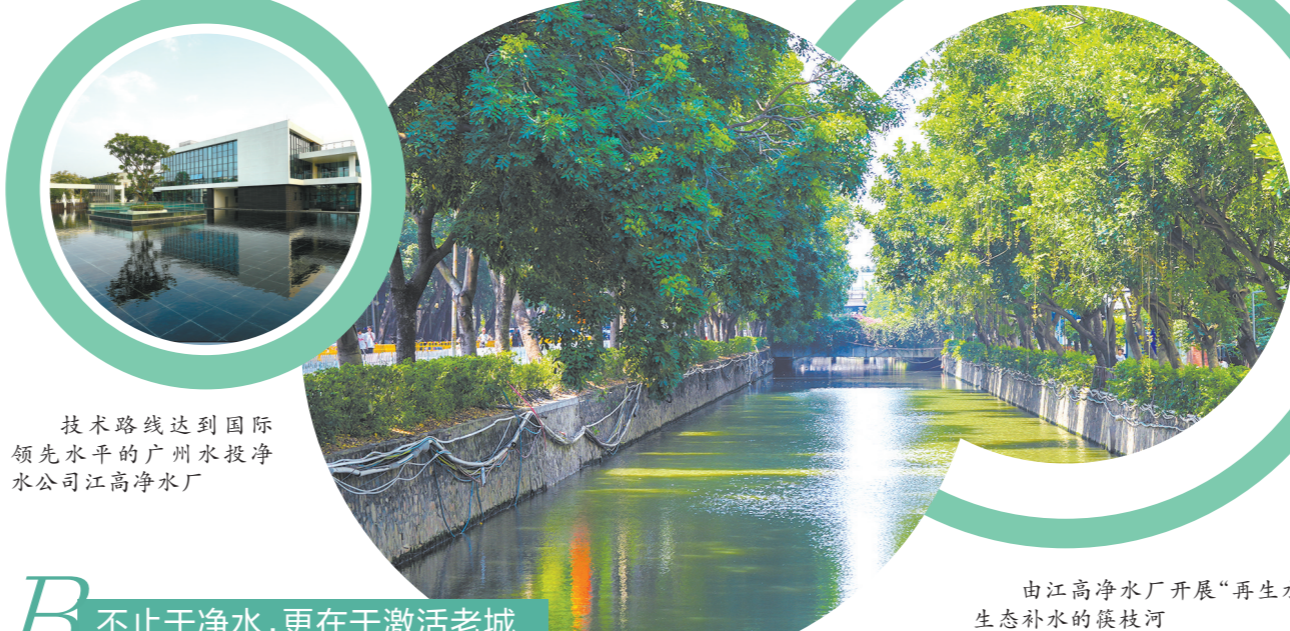
由江高净水厂开展“再生水”生态补水的槎枝河