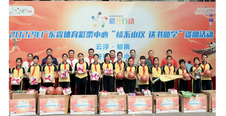
“情系山区 送书助学”活动

9月20日，由广东省体彩中心、广东省教育基金会和云浮市体彩中心举办的“情系山区 送书助学”活动走进云浮市郁南县桂圩镇，为桂圩镇小学资助“爱心图书室”，送去6100多册新书。云浮市文广旅体局、云浮市体彩中心、郁南县文广旅体局有关同志以及桂圩镇中心小学师生参加了资助仪式。 此次粤体彩“情系山区 送书助学”活动，由广东省体彩中心和广东省教育基金会向桂圩镇中心小学资助了3500册书籍。根据桂圩镇小学15个教学点的实际情况，云浮市体彩中心再资助2600多册图书和运动器材一批，总价值11.4万元。 本次资助使桂圩镇小学15个教学点共2000多名小学生受惠。书籍的种类涵盖了中国传统文化、寓言、中外文学经典、儿童百科、童话故事、学习字典等领域，非常适合小学生健康成长的阅读需求。体育器材包括篮球、跳绳、乒乓球、羽毛球等，希望孩子们加强体育锻炼，争当“德智体美劳”全面发展的新时代好少年。 (文/胡彦 粤体彩)