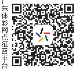
广东体彩网点征召平台