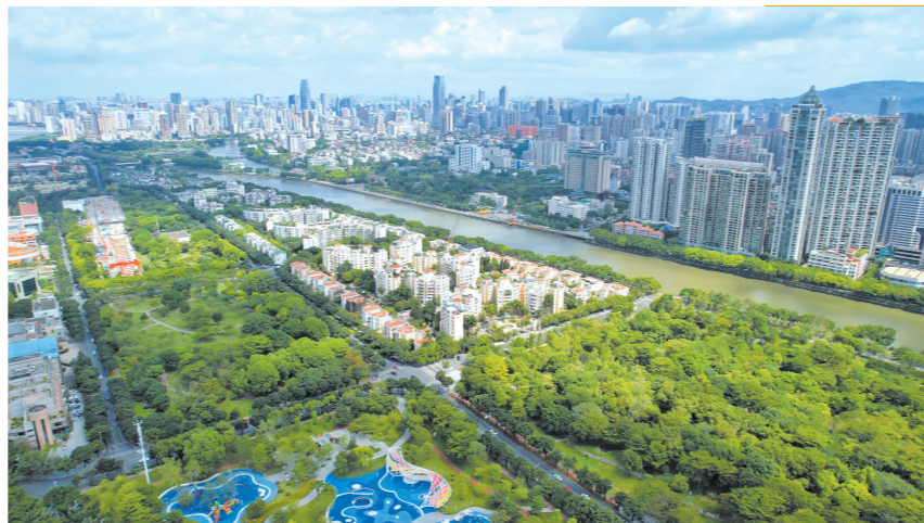
中心区的江景和山景资源为高端物业增添价值

选购此等总价的高端项目，除了考虑空间的尺寸、优越的社区环境外，还需考虑项目所在的地段及区位，这将影响到房子的保值性能；同时需考虑未来的社区物业服务水平，这会影响到未来的居住和生活质量。