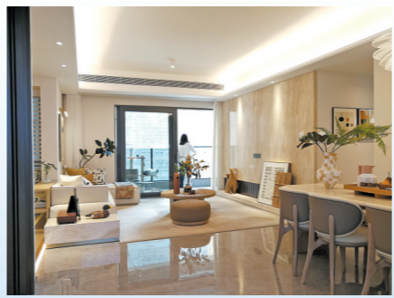
海珠新城在售产品以大户型为主