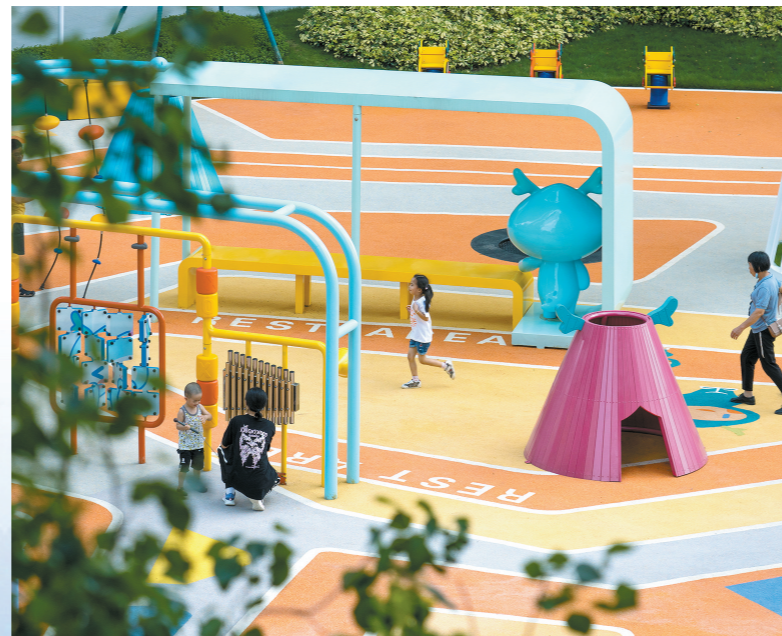
龙湖揽境已经收楼的业主在可爱的儿童区玩耍