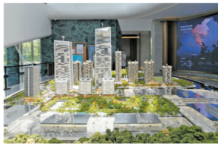
粤海云港城项目将会是城市大型综合体 陈玉霞 摄

该批住宅组团，为沥滘村城市更新项目里融资地块之一，今年属于首发。未来，沥滘村将会打造科技创新文化展示、科创商务、文化创意、品质宜居四大片区，各种配套也会陆续完善。（陈玉霞）