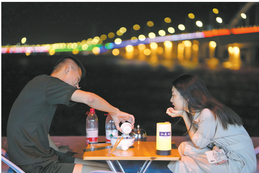
夜市中喝酒的人不多，喝茶的人不少。工夫茶是潮汕的传统