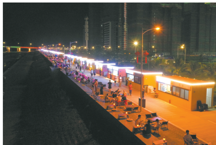
集装箱井然有序，看上去像果冻般美丽

“四方食事，不过一碗人间烟火”。从某种角度来看，夜经济是城市经济社会发展繁荣的一面镜子。受疫情影响，不少地方大力提倡发展“夜经济”。从东海岸夜市的实践效果来看，“夜经济”的发展不仅给城市增添了“烟火气”，也为经济发展注入了强大的动力。