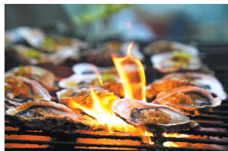
烤生蚝是夜市标配