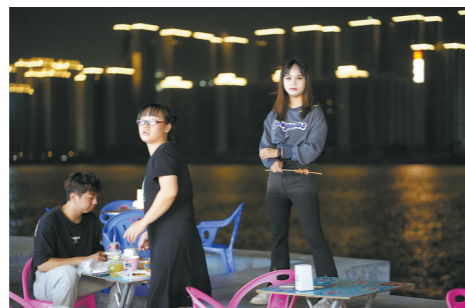
夜市少不了时尚的年轻人