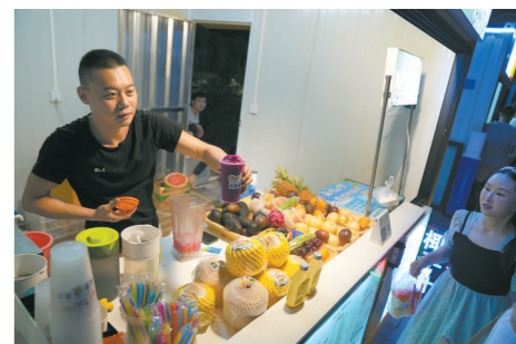
果汁冰老板忙个不停