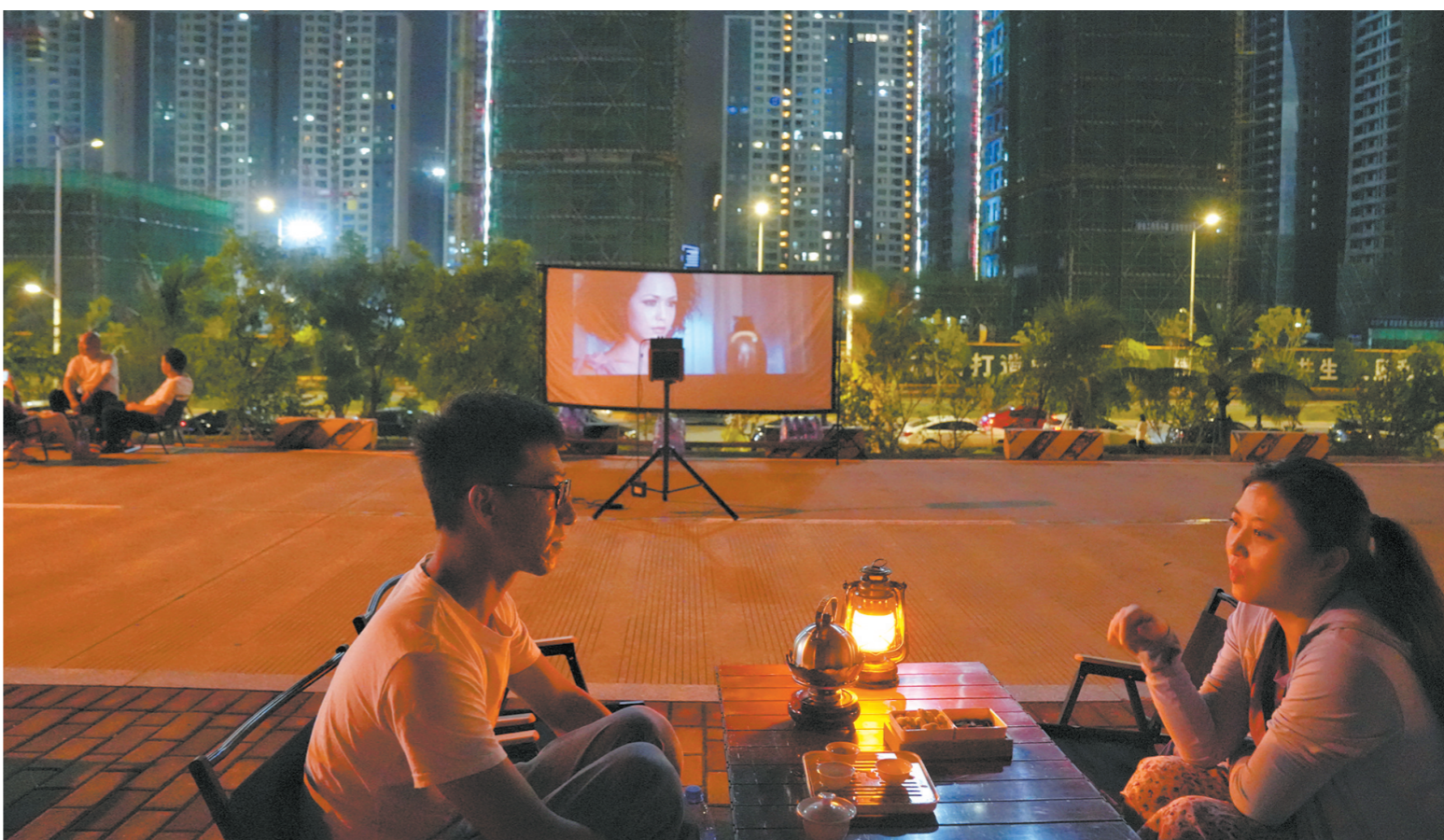
市民下了楼就可前来消费。夜市中还有露天电影放映