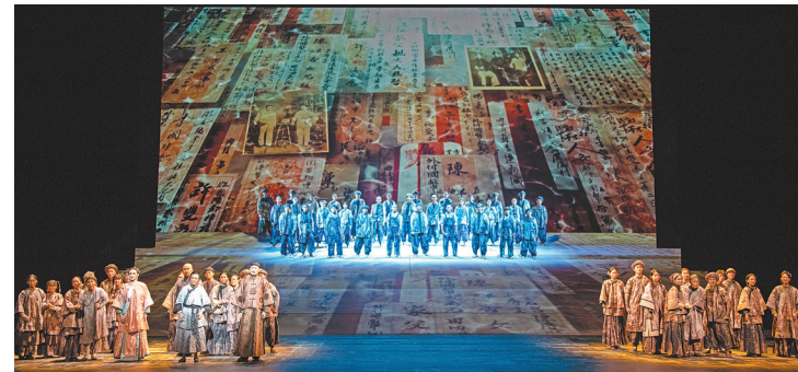
民族歌剧《侨批》现场剧照

羊城晚报讯 记者黄由辉报道：10月4日晚，由中共珠海市委宣传部、珠海高新区管委会出品，珠海演艺集团制作的民族歌剧《侨批》在广州大剧院上演。作为入选国家文化和旅游部“中国民族歌剧传承发展工程”及“历史题材创作工程”重点扶持剧目，该剧集聚了作曲家孟卫东、编剧王勇、导演廖向红、邓一江等国内一流艺术家助阵。