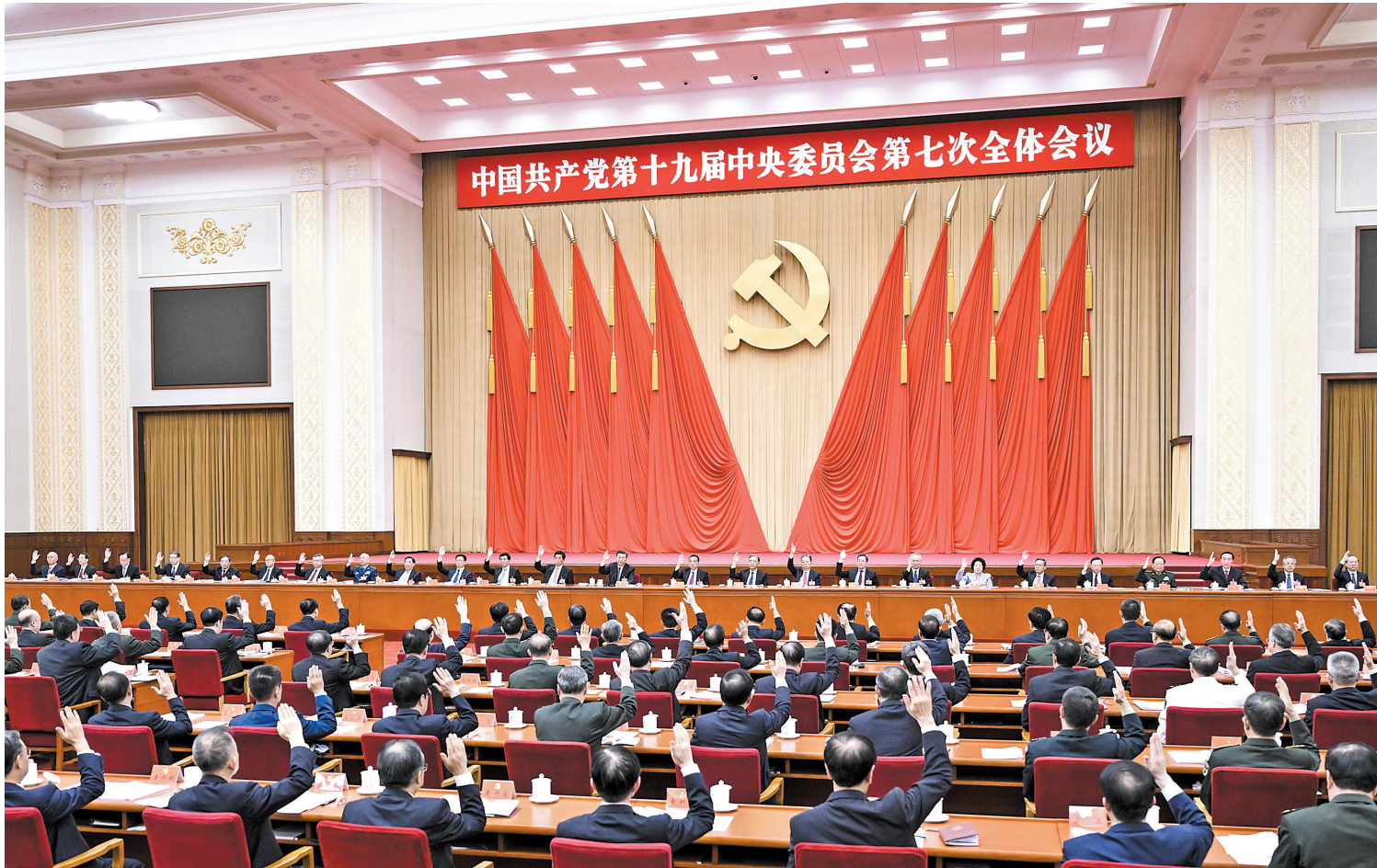
中国共产党第十九届中央委员会第七次全体会议，于2022年10月9日至12日在北京举行。中央政治局主持会议