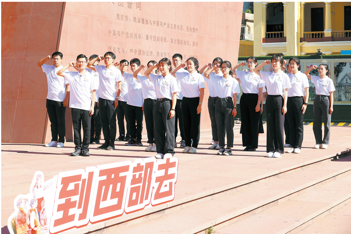
今年7月,西部计划志愿者在团一大广场宣誓出征

青年在哪里,团组织就建在哪里;青年有什么需求,团组织就要开展有针对性的工作。其中,基层团组织是团的组织和工作体系的“神经末梢”,是青年感知共青团、评价共青团的终端窗口。自团中央部署县域共青团基层组织改革试点县(市、区)基层团组织覆盖面明显扩大,并逐步由扩面向提质转变。截至目前,试点地区内有28773个社会领域团组织,增幅达52.7%。其中,传统领域团组织数较改革前新增5456个,累计新增4471个“两新”领域团组织。