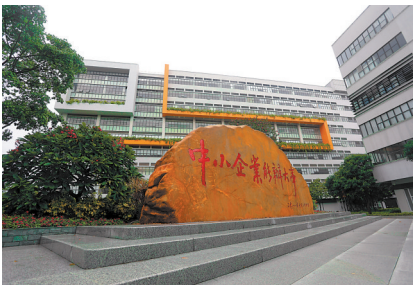
广州开发区科技企业加速器园区,镌刻着“中小企业能办大事”的巨石矗立在广场中央

中小企业千帆竞发、“专精特新”百舸争流的生动场景,成为广州高质量发展的一个时代注脚。