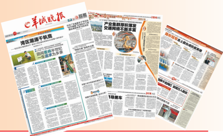
羊城晚报部分相关报道版面

过去十年,江门发生了翻天覆地的变化。经济发展稳中有进,乡村更加美丽、富饶,对外开放水平越来越高……江门每前进一步,羊城晚报都相伴相随。十年间,羊城晚报聚焦江门的经济发展、交通建设、脱贫攻坚、乡村振兴、对外开放、挖掘“侨”文化等方面的重要举措与成果,推出大量报道,为“中国侨都”的发展鼓与呼、为江门的经济社会发展支实招。