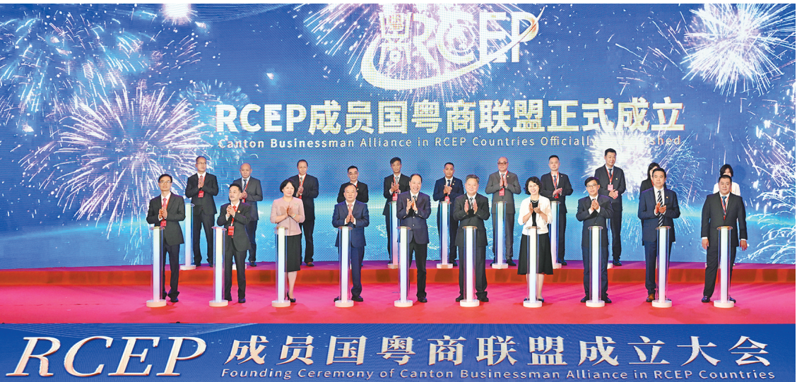
RCEP成员国粤商联盟成立大会在江门举行

江门被誉为“中国侨都”,530万五邑籍港澳台同胞和海外侨胞遍布世界。这让江门具有对外开放的先天优势和巨大潜力。十年来,江门外向型经济成