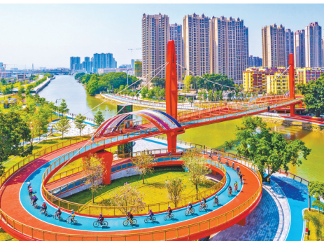
下沙人行天桥

记者了解到,未来,江门将立足生态资源优势,精心塑造“山、水、文、城”共融的城乡整体风貌,大力推进美丽海湾、万里碧道、乡村振兴示范带、国家森林城市、国家公园城市建设,打造粤港澳大湾区人人向往的美丽田园风光城市。