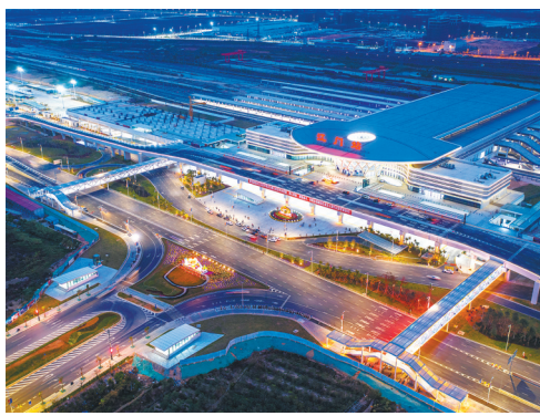
珠西综合交通枢纽江门站

2020年7月,深江铁路开工建设;2020年12月,黄茅海跨海通道全线动工;2021年12月,珠肇高铁江门至珠三角枢纽机场段动工……随着一批重大交通基础设施项目加快建设,江门的枢纽地位还将持续提升。