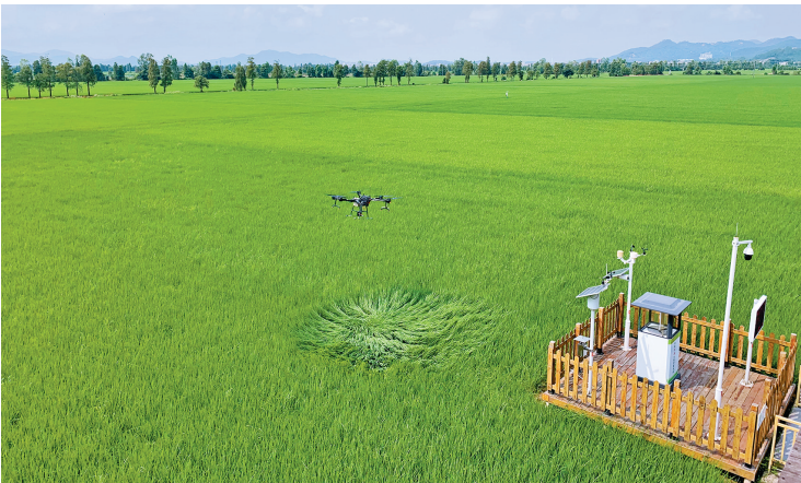
江门台山,种粮用上了高科技

2019年,羊城晚报策划推出了“寻找乡村振兴新势能”专题,从江门出发,走进广东各地田间地头,采访以产业振兴乡村的榜样典型。新会陈皮、红木家具、