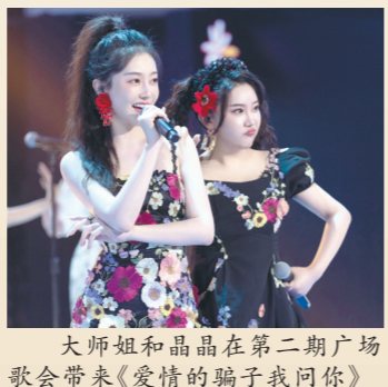
大师姐和晶晶在第二期广场歌会带来《爱情的骗子我问你》