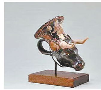
公元前4世纪南意大利出产的牛头形红彩陶来通杯