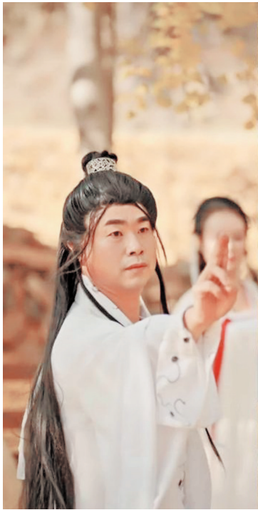
古风装扮的解伟

日前，湖北省随州市文化和旅游局局长解伟古装扮相出境，推介当地千年银杏谷景区，被不少网友调侃“辣眼睛”。解伟回应称，哪怕是献丑，也要让更多人知晓随州的美景。