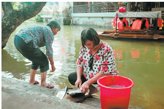
村民在水边杀水鱼。自古道,靠山吃山,靠水吃水。这里四面环水,水系发达,河网串联起周边丰富的乡村资源,溯河而上,周边桑基鱼塘密布,一派水乡风光