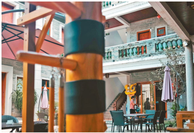
村民的客栈院子里,咏春拳元素极具佛山特色