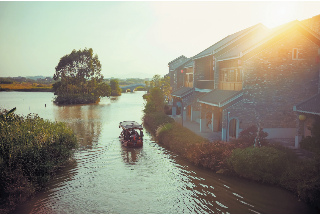
古劳水乡旅游区在尊重乡村生活方式和保护当地自然环境的前提下,链接和融合都市与乡村的魅力,将当地文化融入产品体验,实现乡趣生活美学的全场景呈现,开启乡趣新视野