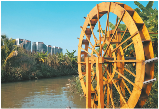
横海游梦航线全长6公里。通过“去赶圩”“去渔耕”“去展艺”等三大场景,去展示古劳的花海绿廊、小桥流水、蛙鸣鸟叫、流水潺潺等等。沿途还能看见水车、瓜果棚架、养蚕棚架、渔网、稻草人、茅草屋、木人桩、水上梅花桩等水乡特有的元素