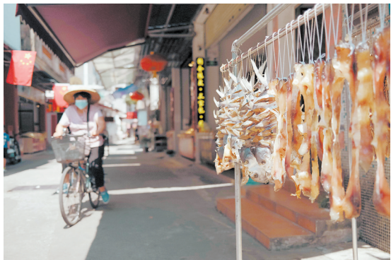
晒鱼干,是水乡村民为自己贴上最地道的标签