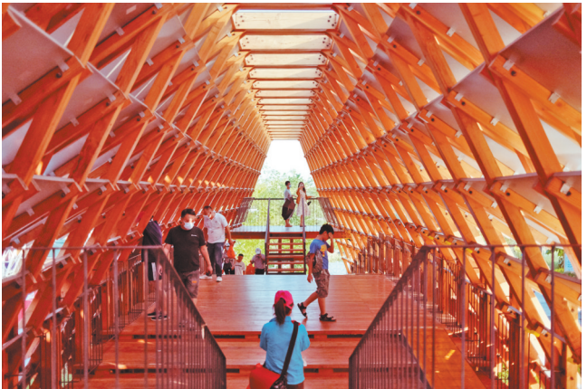
这座木廊桥是古劳水乡众多桥梁中的一座,为了区别于城市化建设,重塑传统乡土文化,采取以“自然材-木料”进行“拱桥”建造