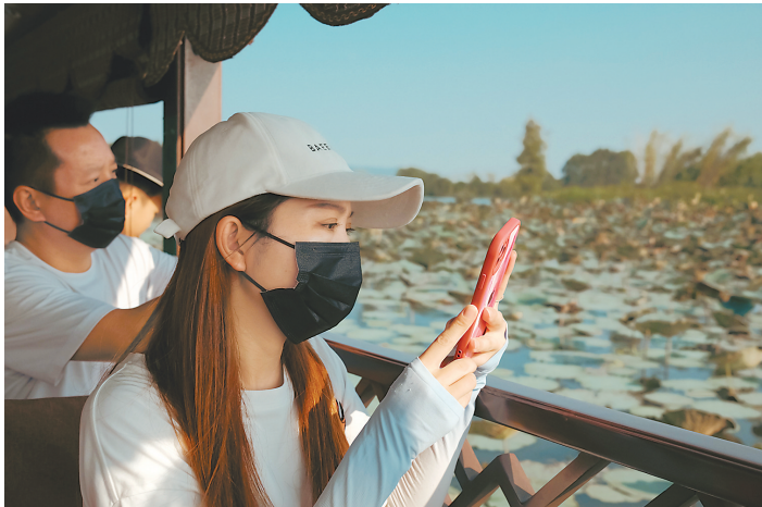
乘船横海游梦,人们用眼睛和耳朵去欣赏旅游区“三百亩荷花竞相争艳,千鸟鹭鸣”的美景