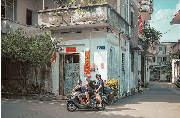
街巷,无不透露着悠然自得的气息