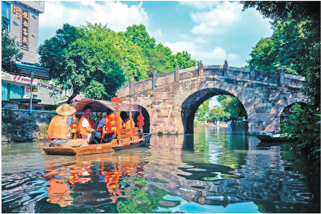
逢简水乡,有“广东周庄”之称。秋日的逢简水乡绿树成荫,树影斑驳,乌篷船静静地漂于水上,美景如诗如画