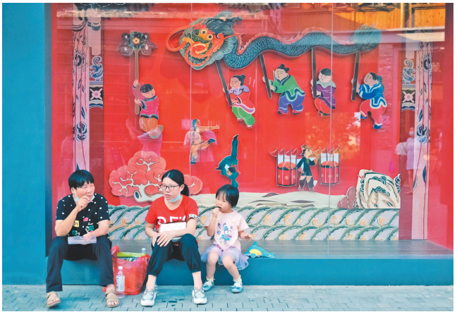
滨水商业街几乎每一个橱窗都洋溢着岭南节庆的气氛