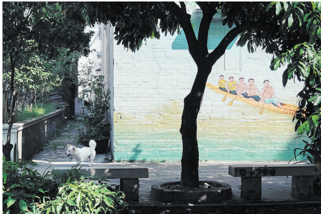
逢简水乡里画满了历史,岭南赛龙舟的景象活现于墙上,悠闲的小狗与壁画动静交替