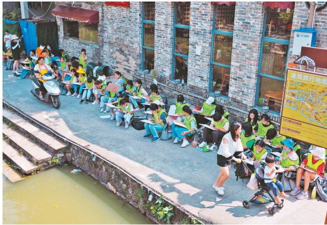
水在林中,景在画中,写生的学生们在河岸边用画笔描绘着水乡风景