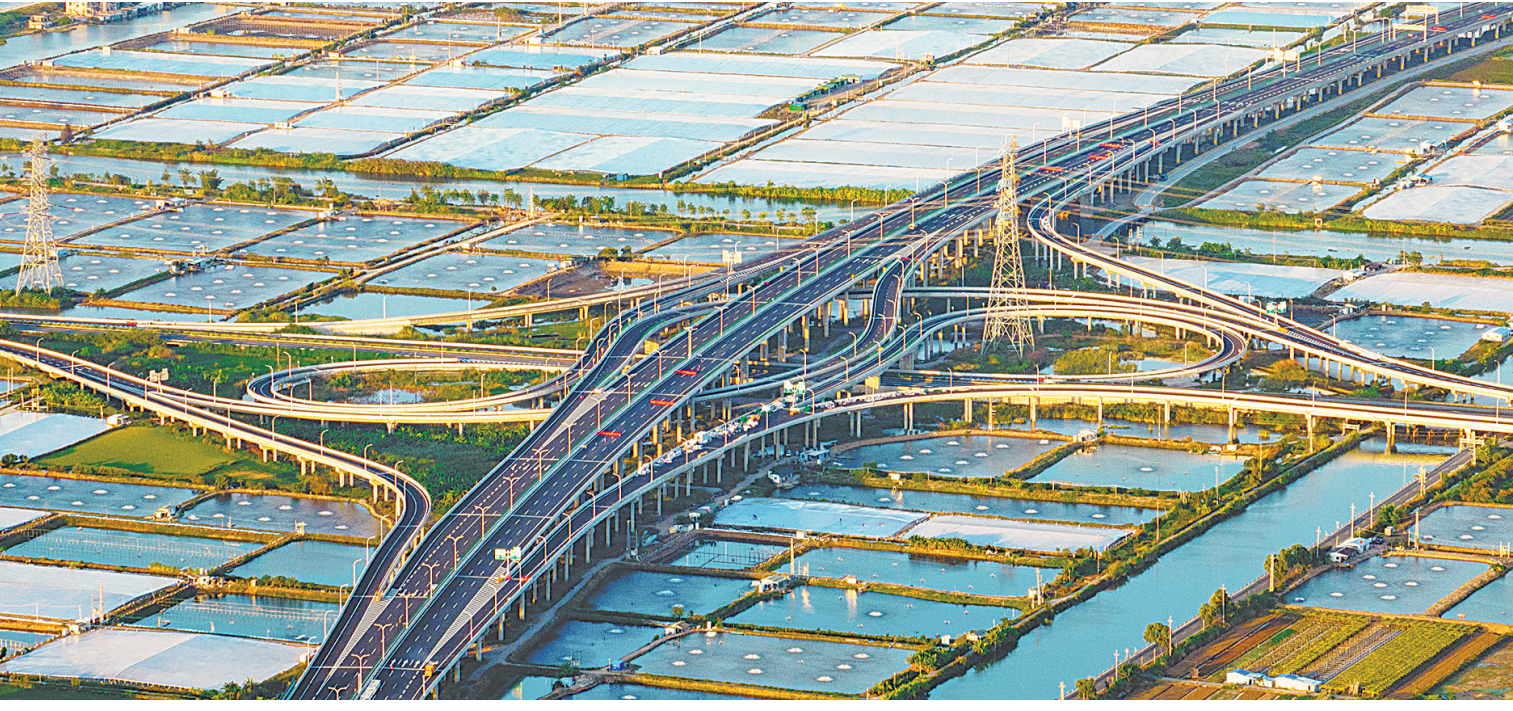
香海大桥已经正式通车

羊城晚报讯 记者郑达报道：珠海交通建设又传捷报！11月6日，香海大桥正式通车，实现珠海香洲至斗门最快15分钟的高效通勤。