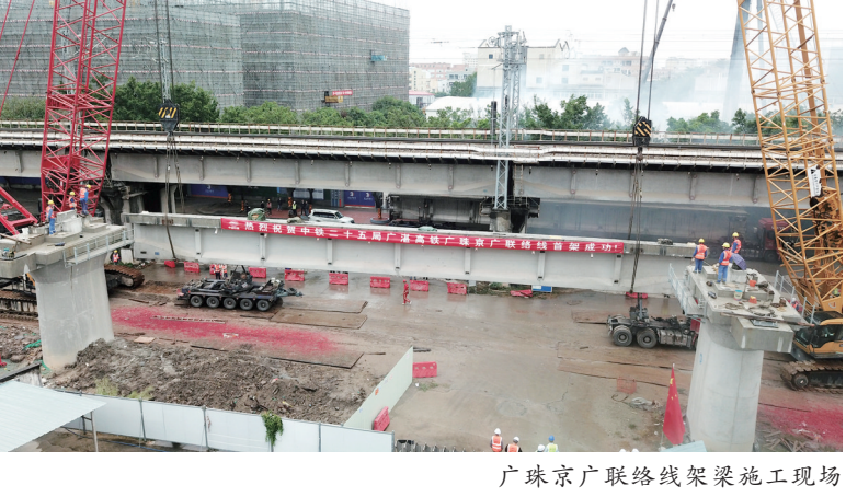
广珠京广联络线架梁施工现场

羊城晚报讯 记者李志文，通讯员刘栋杰、阳亚军摄影报道：11月5日18时28分，珠机城际二期首组400米长钢轨稳稳落入承轨槽内，标志着珠机城际二期珠海长隆站至珠海机场段进入关键性施工节点——长钢轨铺设阶段。