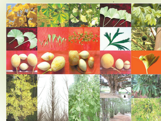
多彩多样的银杏品种

虽然目前针对银杏长寿的分子生物学研究还不是很深,但相信随着林木生物技术的不间断进步,对银杏长寿的机制必将会有更精彩的解读。