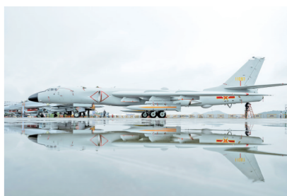
轰-6携新型导弹来参加航展