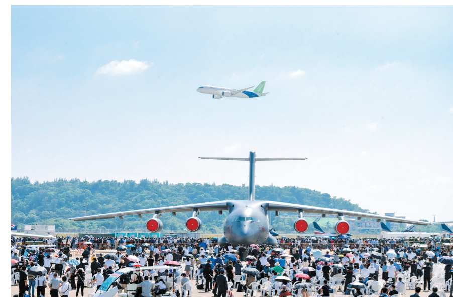
运20和c919双双现身珠海