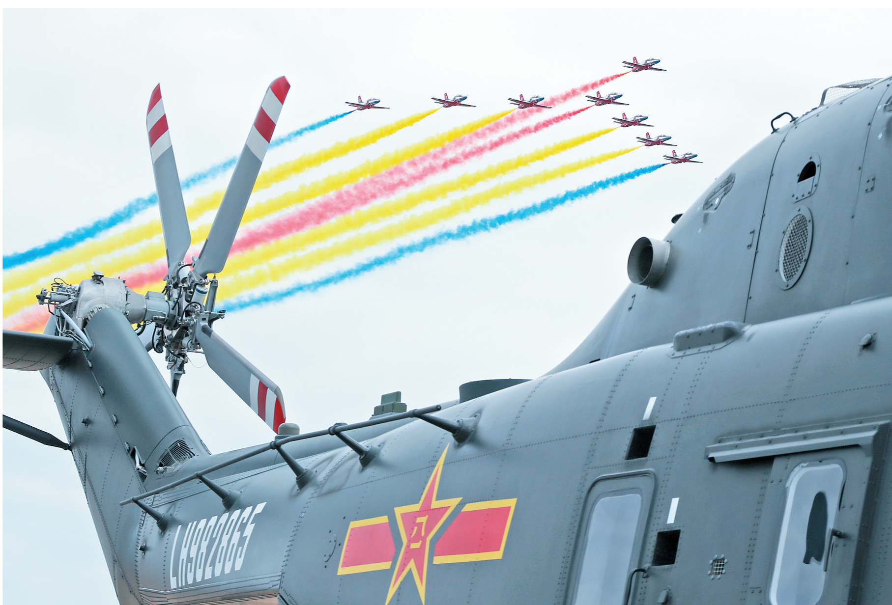
展翼空天 飞向未来——战鹰用壮美航迹庆祝人民空军成立73周年