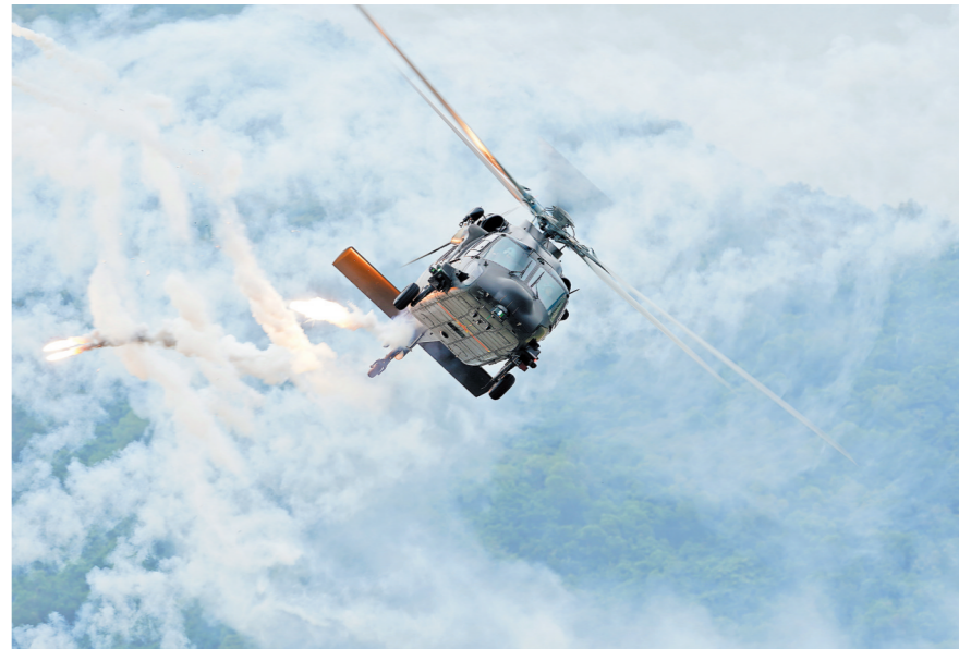
陆军空中突击力量直20空中机动飞行展示