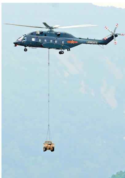
陆军空中突击力量直8L吊装山猫全地形车