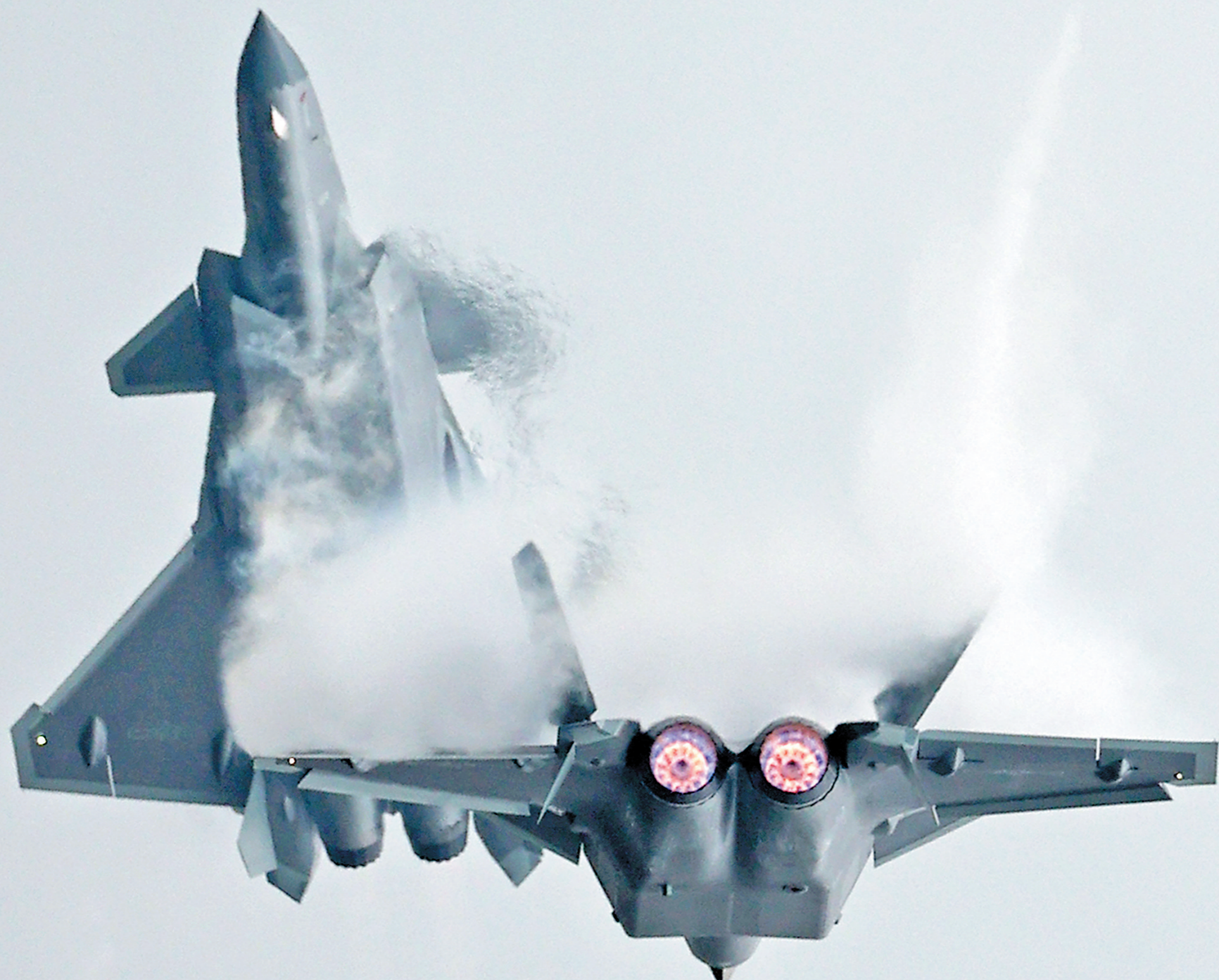
歼-20上演双机对飞引燃航展气氛,展示了它强大的机动性和飞机性能