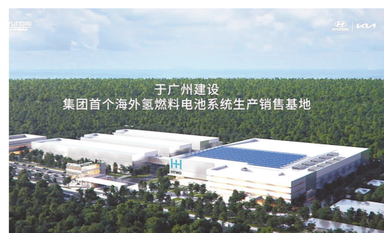
现代汽车“HTWO 广州”效果图