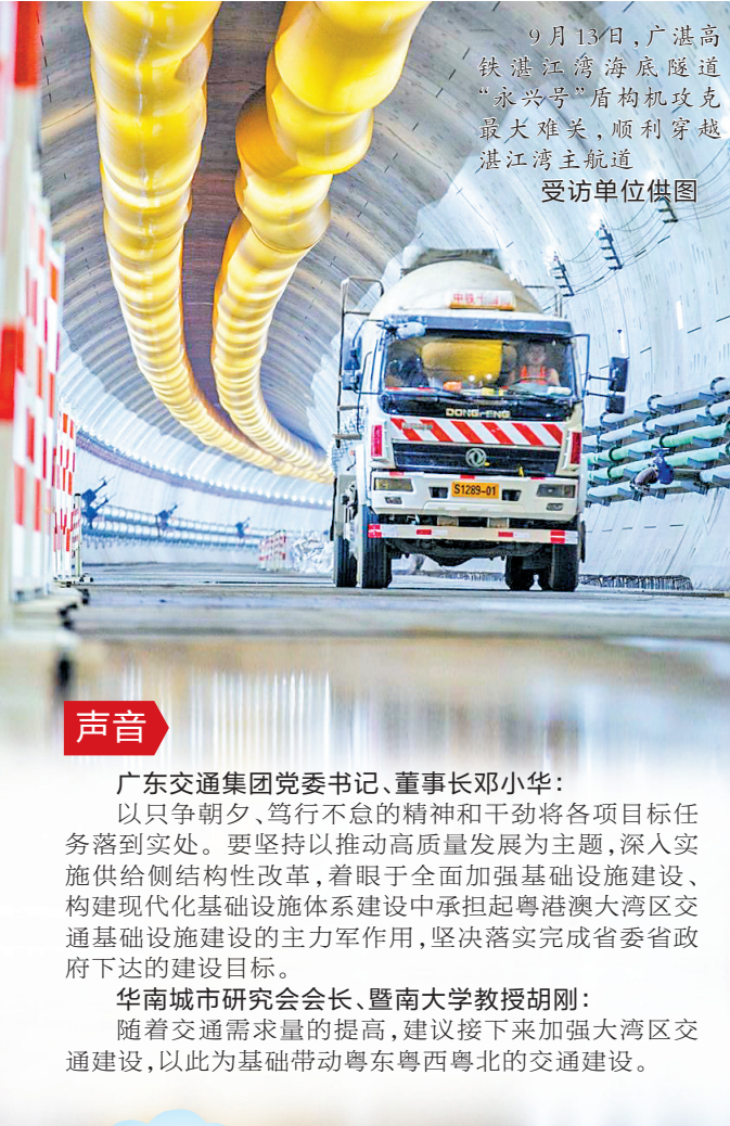
9月13日,广湛高铁湛江湾海底隧道“永兴号”盾构机攻克最大难关,顺利穿越湛江湾主航道。

2022年,广东交通强省建设蹄疾步稳,一张畅通湾区、联通全国、融通全球的现代化交通网络正在加快织就。