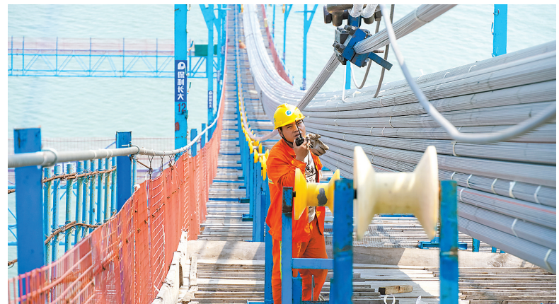
正在建设中的深中通道伶仃洋大桥

接下来,广东省交通运输系统将抢抓四季度施工建设“黄金期”,协调各方加大要素投入和资金保障力度,重点加快交通基金项目进度,狠抓计划新开工项目和建成项目,大力督办滞后项目,确保如期优质完成奋斗目标任务。到11月30日,广东预计还将开工建设34个基金项目,累计投资总额超过4600亿元。