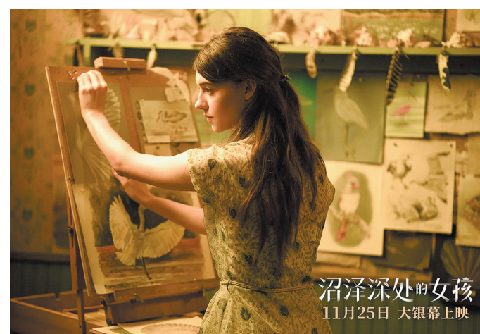
《沼泽深处的女孩》11月25日 大银幕上映

在全球多个国家和地区上映，凭借跌宕起伏的剧情、唯美诗意的沼泽风光、演员们精湛的演技和引人入胜的共鸣感，赢得影迷的盛赞。目前，影片全球票房已成功突破1.4亿美元，烂番茄爆米花指数稳步攀升至97%，豆瓣评分7.7分。“霉霉”泰勒·斯