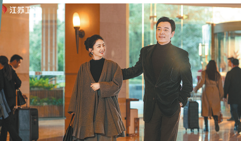
现实题材电视剧《风吹半夏》官宣定档，11月27日19:30起登陆江苏卫视幸福剧场。该剧由傅东育、毛溦执导，赵丽颖、欧豪、李光洁领衔主演，刘威、柯蓝、任重、冯嘉怡特邀主演，孙千、黄澄澄、是安、宋熹、王西、黄义威联合主演，王劲松、刘威葳特别出演。