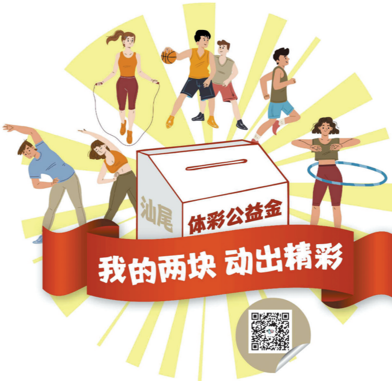
我的两块 动出精彩

汕尾市体彩公益金在其中的提供强力支撑，为提升城市品牌形象，推动城市综合发展贡献力量。汕尾体彩将始终践行“公益体彩 乐善人生”的品牌理念，保持着健康、持续发展的良好态势，为人民的美好生活带来更多助力。