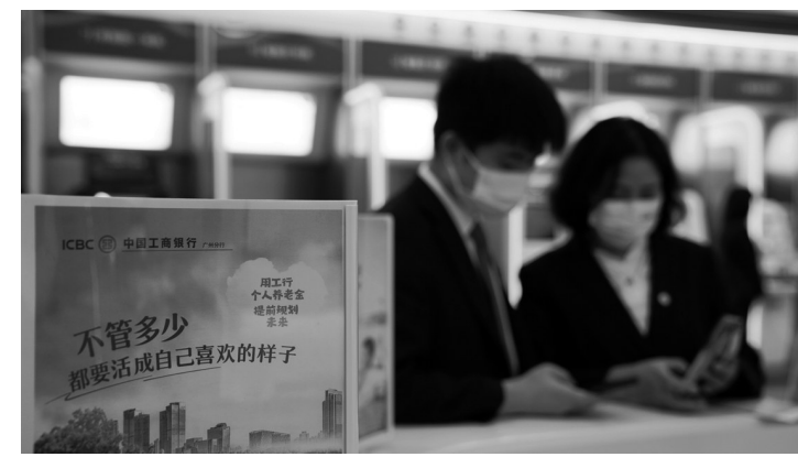
银行工作人员给广州市民讲解如何注册个人养老金账户

11月28日上午,广州市人社局、广州发展集团与工商银行广州分行,在广州发展集团“共享·发展”党员活动中心开展了“学习贯彻党的二十大精神暨个人养老金政策宣讲”主题党日活动。与会三方先是共同参观了广州发展集团党建及企业文化展厅,然后就学习贯彻二十大精神,建设多层次养老体系尤其是共同发展个人养老金业务进行了深入交流。