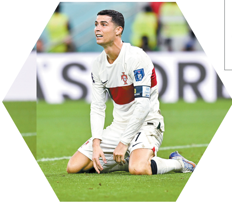
2022世界杯, C罗在比赛中

小组赛首战,葡萄牙以1比0小胜摩洛哥,C罗开场仅4分钟就顶进全场唯一进球。最后一轮小组赛,葡萄牙以1比1被伊朗逼平,C罗罚丢一个点球。1/8决赛,葡萄牙以1比2被乌拉圭淘汰出局,C罗仍旧无法打破自己在世界杯淘汰赛阶段的进球荒。