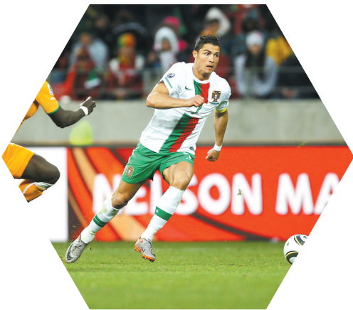
2010世界杯, C罗在比赛中拼抢