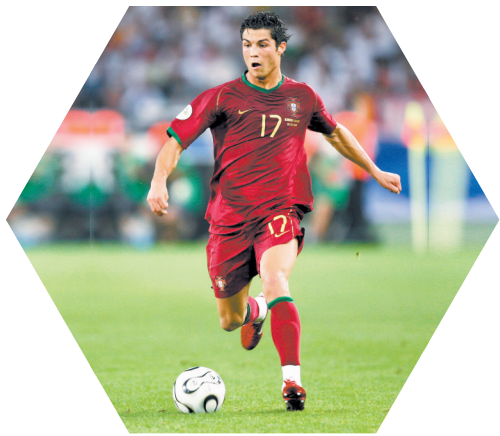
2006世界杯, C罗在比赛中

1/8决赛,葡萄牙以1比0力克C组第二荷兰,两支以进攻华丽著称的球队却上演了一场犯规大战。俄罗斯主裁判伊万诺夫整场比赛出牌20次,包括4张红牌,葡萄牙的