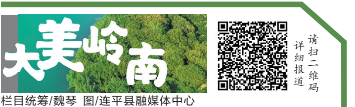
大美岭南 栏目统筹/魏琴

羊城晚报讯 记者程行欢报道:12月20日9时38分,随着中国广核集团(以下简称“中广核”)汕尾甲子240万千瓦海上风电项目最后一台风电机组并网发电,中广核汕尾甲子90万千瓦海上风电场正式实现全容量并网发电,标志着全国最大的平价海上风电场建成投运。 中广核汕尾甲子海上风电场场区中心离岸距离约25千米,水深30米到37米,布置78台6.45兆瓦和50台8.0兆瓦海上风电机组,配套建设2座220千伏海上升压站及一座500千伏陆上升压站。汕尾甲子二项目于2022年6月海上主体开工,仅用时半年实现全容量并网发电,创造了新的行业纪录。 在汕尾海域,中广核已于2021年11月25日建成汕尾后湖50万千瓦海上风电场,随着汕尾甲子90万千瓦海上风电场的建成投运,粤东首个超百万千瓦级海上风电基地正式建成,共计装机容量140万千瓦。该基地每年可为广东省提供清洁电能超45亿千瓦时,可等效减少标煤消耗约145万吨,减少二氧化碳排放量约350万吨,相当于植树造林约9000公顷。