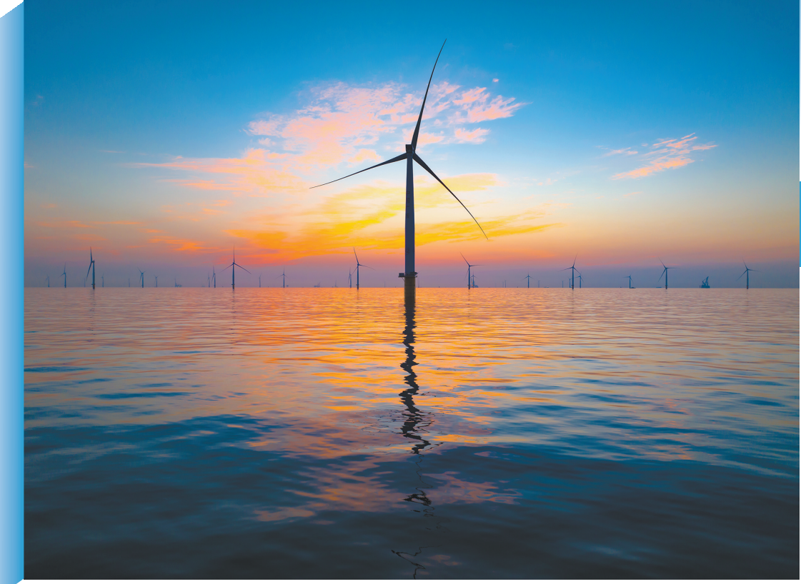
中广核汕尾甲子90万千瓦海上风电场 受访者提供