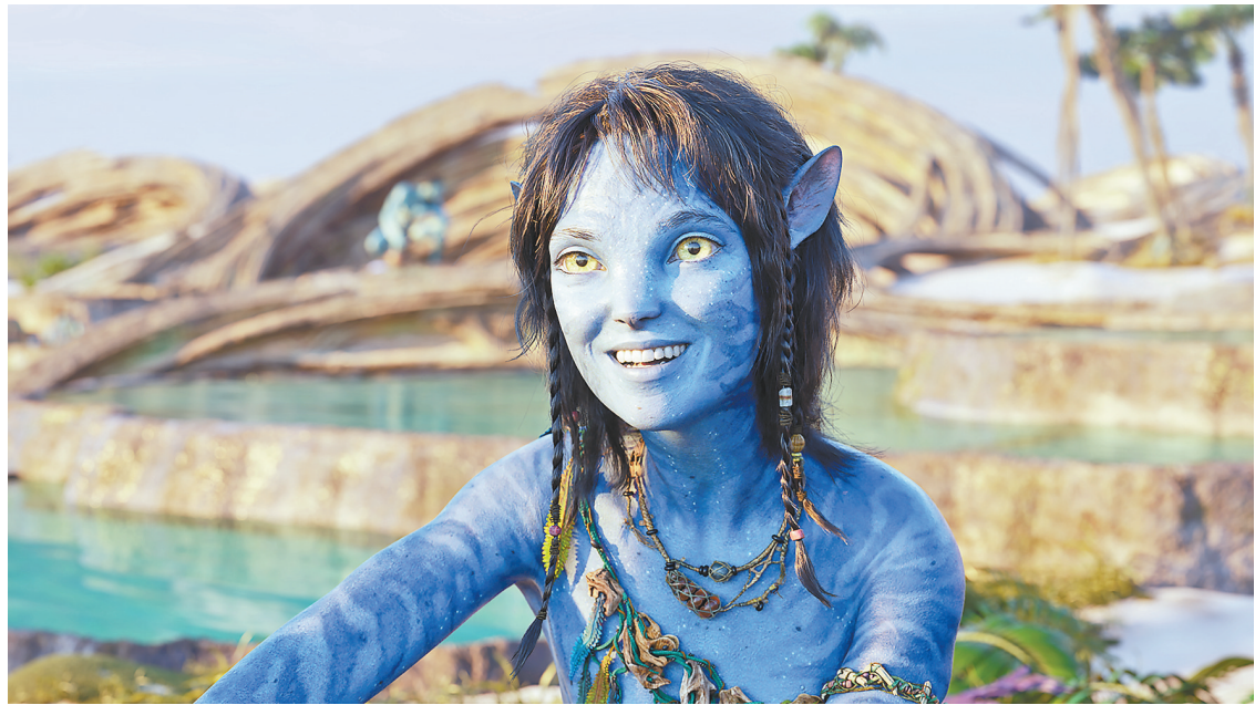
西格妮·韦弗在《阿凡达2》中饰演14岁的琪莉

被提名过三次奥斯卡、四次艾美奖、一次托尼奖,获过两次金球奖,今年还在第12届北京国际电影节天坛奖拿下最佳女配角,西格妮·韦弗绝对是影视圈的老戏骨。但若不是卡梅隆念旧,把早当了奶奶的她拎回片场挑战高难度逆龄表演,人们可能已快忘记当年曾在《异形》系列里大放光彩的韦弗究竟有多大能耐。《阿凡达2》里高超的面部与动作捕捉技术,让韦弗如同片中那些由人类变身的阿凡达那样,拥有了更年轻的面容与身体。不过,真正令她永葆青春的还是人类永不言败的精神——为了拍好《阿凡达2》的水下戏,她用了整整一年时间来训练自由潜水,最后能在水中一口气憋上6分半钟!