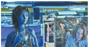
琪莉望着母亲格蕾丝的视频

在《阿凡达》的故事里,身为科学家的格蕾丝博士并不赞同RDA的掠夺计划。她发现,整个潘多拉星球如同一个完整的生命体,而其中的森林更如神经网络一般,能让纳威人通过其进行生命连接和记忆传承。她反对RDA为掠夺矿产而肆意破坏森林,最后还在双方军队的决战中身负重伤。为了拯救她,杰克和纳威人试图把她的意识向其阿凡达身体转移,但不幸失败了。