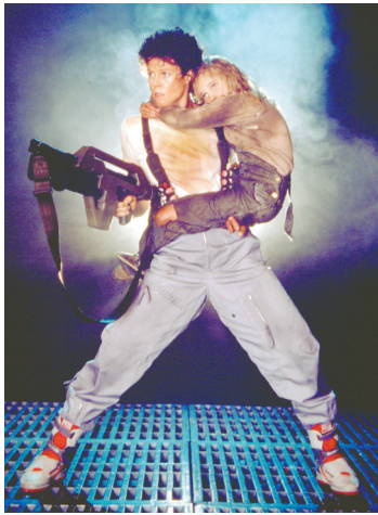
韦弗在《异形2》中扮演雷普利