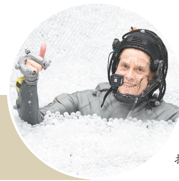
拍摄中的西格妮·韦弗

羊城晚报记者 李丽 詹姆斯·卡梅隆的《阿凡达：水之道》(又名《阿凡达2》)正在影院热映。作为史上最高票房电影《阿凡达》的续集,《阿凡达2》的每个制作细节都备受关注。但很多忙着拆“彩蛋”的观众,却没注意到该片有一个真正的超级“彩蛋”,那就是在片中饰演14岁少女琪莉的西格妮·韦弗——生于1949年的她,今年已经73岁了。