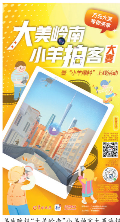
羊城晚报“大美岭南”小羊拍客大赛海报

“小羊爆料”是羊城晚报报业集团基于超过1.6亿粉丝的“1+2+3+N”立体移动传播链重点打造的新闻线索收集平台。拍客大赛结束后，您还可以持续通过羊城派客户端、“小羊爆料”微信和抖音小程序进行爆料，您的爆料将有机会被专业媒体报道，您的作品将有机会得到千万级流量曝光。