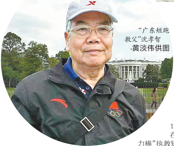
“广东短跑教父”沈孝智

孝智曾表示最辉煌的岁月还要感谢几位徒弟：1979年第四届全运会，袁国强获得男子100米和200米冠军；1980年，袁国强、何宝栋、余壮辉和王少明称霸国内男子4×100米接力；1982年亚运会，沈孝智带着“短跑四少”以破亚运会纪录的成绩夺得4×100米接力冠军；1983年第五届全运会，广东田径队以10金创造历史最佳成绩，其中沈孝智的弟子何宝栋一人就独揽男子100米、200米、4×100米和4×400米四枚金牌；1987年第六届全运会，广东田径队再拿9金，沈孝智的弟子又夺得男子400米、4×100米和4×400米冠军。爱徒袁国强曾三次创造全国男子100米纪录，沈孝智的“徒孙”、袁国强的徒弟苏炳添则成为首位百米突破10秒大关的亚洲运动员，东京奥运会更以百米9秒83的成绩惊艳世界。