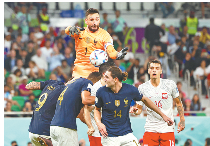
在内讧中宣布退队的洛里(上)