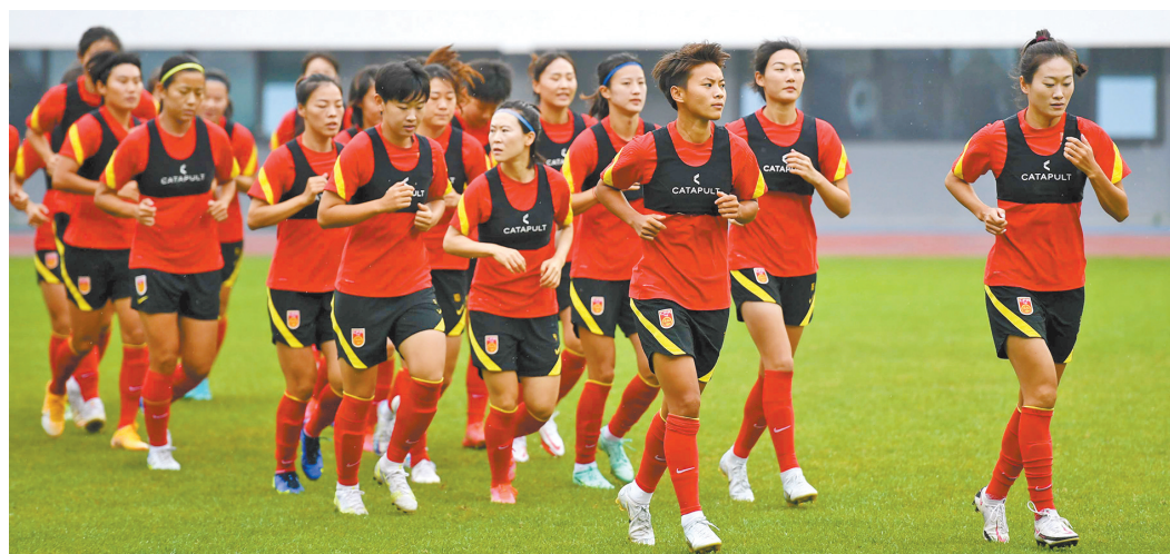
训练备战中的中国女足

首阶段晋级的7支球队将和未参加首阶段赛事的5支球队一同参加第二阶段赛事。12队分为3个小组，亚足联届时将根据最新的国际排名，对这12支球队进一步分档，排名前3位的球队，将成为种子队。目前中国队在亚足联排名第4位，要想成为种子队，就必须在7、8月间的女足世界杯上有出色的表现，抢到足够