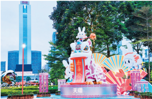
天环广场醒狮瑞兔造型祥和喜庆,展现岭南文化特色

“2023年,广州将有五个项目,共32万平方米的优质商业面积落成,其中珠江新城及北京路都将有小体量项目落成,而大悦城也将开出在广州的首个项目,优质零售物业市场将持续复苏。”世邦魏理仕中国区战略顾问部商业咨询负责人钟廉军向记者表示。