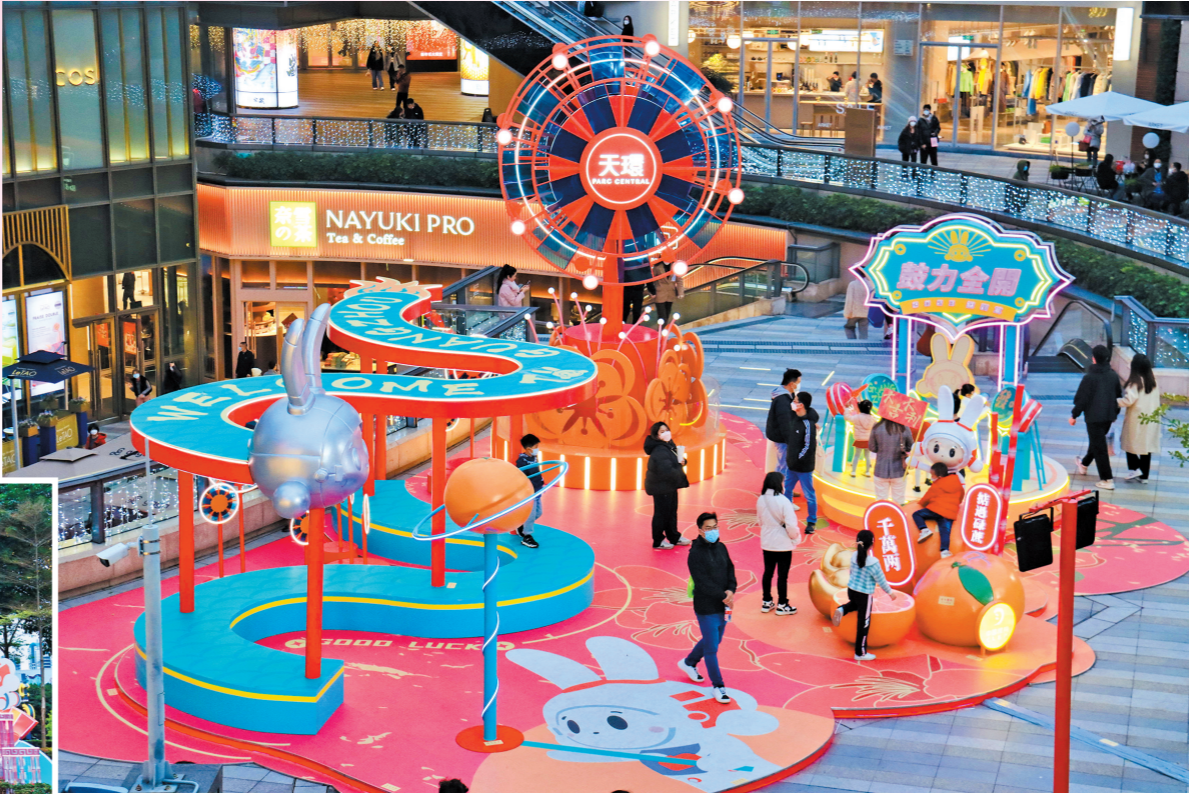
商城户外美陈奇幻无穷,吸引市民打卡拍照