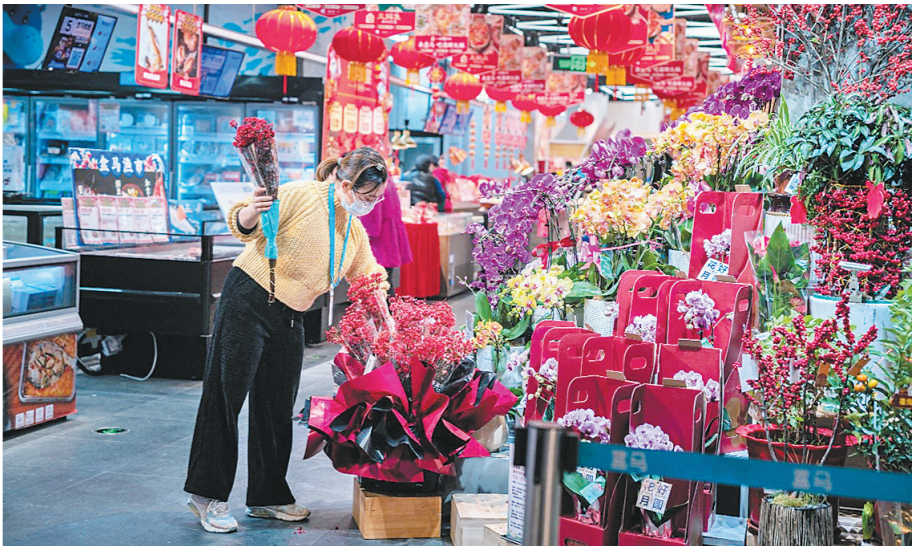
科研产品走出实验室,广州红掌加入盒马年花热销大军