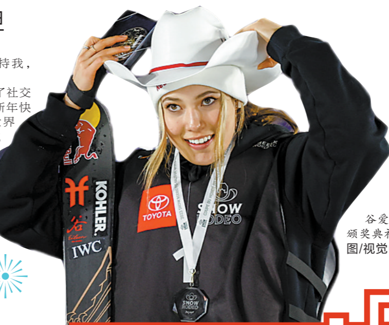
谷爱凌在颁奖典礼上。

在第二场决赛中，谷爱凌三轮比赛得分均在90分以上（第一轮90分、第二轮93.50分、第三轮91.75分），也是全场唯一得分过90分的选手。