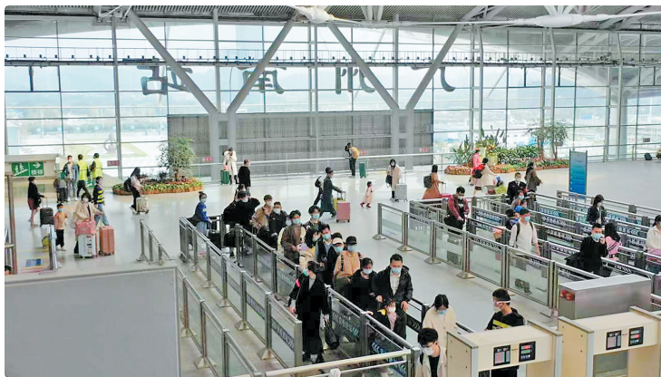
26日，广州南站旅客有序通过安检通道

羊城晚报讯 记者李志文，通讯员胡靖、郭静、付薇报道：记者从广州集团获悉，1月26日（正月初五）是春运第20天，广州集团预计发送旅客153万人次，同比增加16万人次，增长11.7%，27日、28日将迎来客流最高峰。