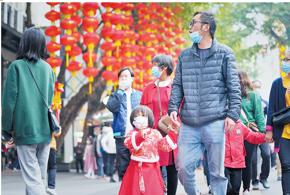
大年初一，北京路商圈人潮涌动