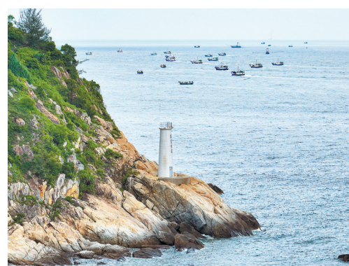
阳江海边风景宜人