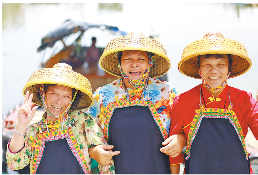
阳江溪头渔港唱成水歌的渔民

在中国，山北水南曰阳，山南水北曰阴，阳江在江之北，所以叫阳江。羊城晚报“大美岭南”栏目第36站走进“中国南海渔都”阳江。地紧邻珠三角，扼粤西要冲，地势由北向南倾斜，依山傍海，东北有天然屏障，西北有云雾山环绕。山的灵秀和海的深邃，在这里交融，当阳光洒向母亲河漠阳江，当鸕鶒从晨曦中苏醒过来，漠阳江水流不息，千帆竞发，百舸争流。 (魏琴 戴灵感)