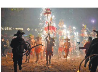
揭阳烟花火龙表演

羊城晚报讯 记者张晚宣报道：1月31日晚，农历正月初十，国家级非遗项目揭阳乔林烟花火龙表演在揭阳誉东街道乔南、乔东、乔西各村震撼登场，3条祥龙、3条彩凤、24条鲤鱼与一批彩旗轮番登场，展现非遗民俗魅力。