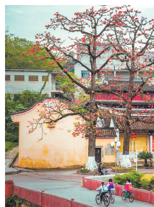
梅州东山书院

在建设过程中，梅州充分发挥非遗资源优势，推动文化创意、文化活动、演艺精品进校园、进景区、进展区，精心打造“客家文化公益讲堂”“周五有戏、相约周六”等文化惠民金字招牌；并以客家非遗为题材，创演《春雨》《林凤眼》等一批具有岭南气派、客家风格、梅州特色的精品力作，助力人文湾区建设。同时，设立非遗扶贫就业工坊，大力推进“粤菜(客家菜)师傅”工程，带动贫困脱贫，全力助推乡村振兴。