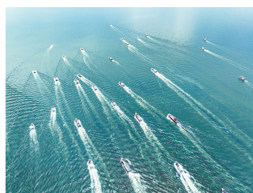
开渔节千帆竞发