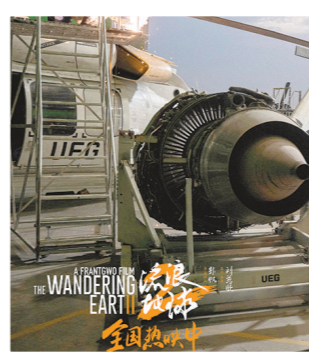
相比第一部,《流浪地球2》视效场景规模升级