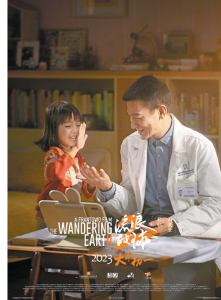
刘德华扮演的图恒宇对已逝女儿丫丫的眷恋令观众泪目