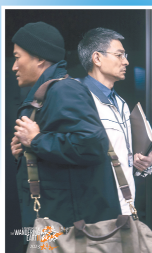
吴京和刘德华时隔多年后再度合作