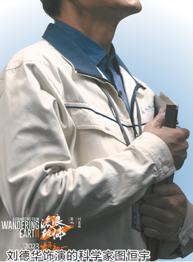
刘德华扮演的科学家图恒宇

问:具体是用什么方法来梳理? 郭帆:比如在拍《流浪地球2》的时候,这个课题组共有20多名实习生进到剧组里,人多到我一开始都没认全!他们的工作就是到每一个制作部门去“记错”。他们有一个表格,每天看到谁做错了什么,就记录下来——不是打小报告用的啊(笑)。