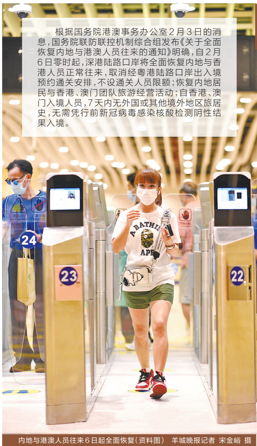
内地与港澳人员往来6日起全面恢复(资料图)

根据国务院港澳事务办公室2月3日的消息，国务院联防联控机制综合组发布《关于全面恢复内地与港澳人员往来的通知》明确，自2月6日零时起，深港陆路口岸将全面恢复内地与香港人员正常往来，取消经粤港陆路口岸出入境预约通关安排，不设通关人员限额；恢复内地居民与香港、澳门团队旅游经营活动；自香港、澳门入境人员，7天内无外国或其他境外地区旅居史，无需凭行前新冠病毒感染核酸检测阴性结果入境。