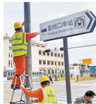
市政工人加紧整理路标指示牌

3日，羊城晚报记者实地走访即将恢复通关的罗湖口岸和皇岗口岸了解到，各口岸已做好恢复通关准备，周边商铺经营者纷纷准备开业迎接跨境旅客的到来。