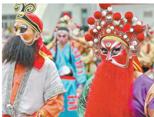
▲英歌舞的妆容也十分英武大气

广东省文化馆原馆长、非遗保护专家杨明敬研究传统舞蹈多年，在他看来，英歌“火出圈”表明，如今非遗的传播要更多借助新媒体的力量。“让社会各界更多地认识优秀的非遗项目，非遗的发展和传承就更有意义。观众因感性进入，才会产生兴趣，进而就会想到现场去感受民间艺术的魅力。新媒体能起到很好的助推作用。”杨明敬说。